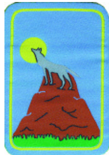
3° momento: Lupo anziano