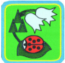
Coccinella del bosco