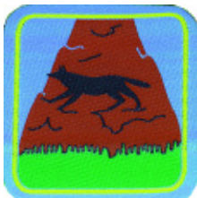
2° momento: Lupo delle rupe