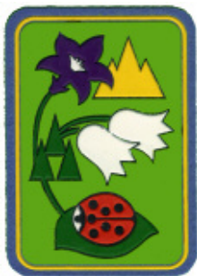
Coccinella della montagna